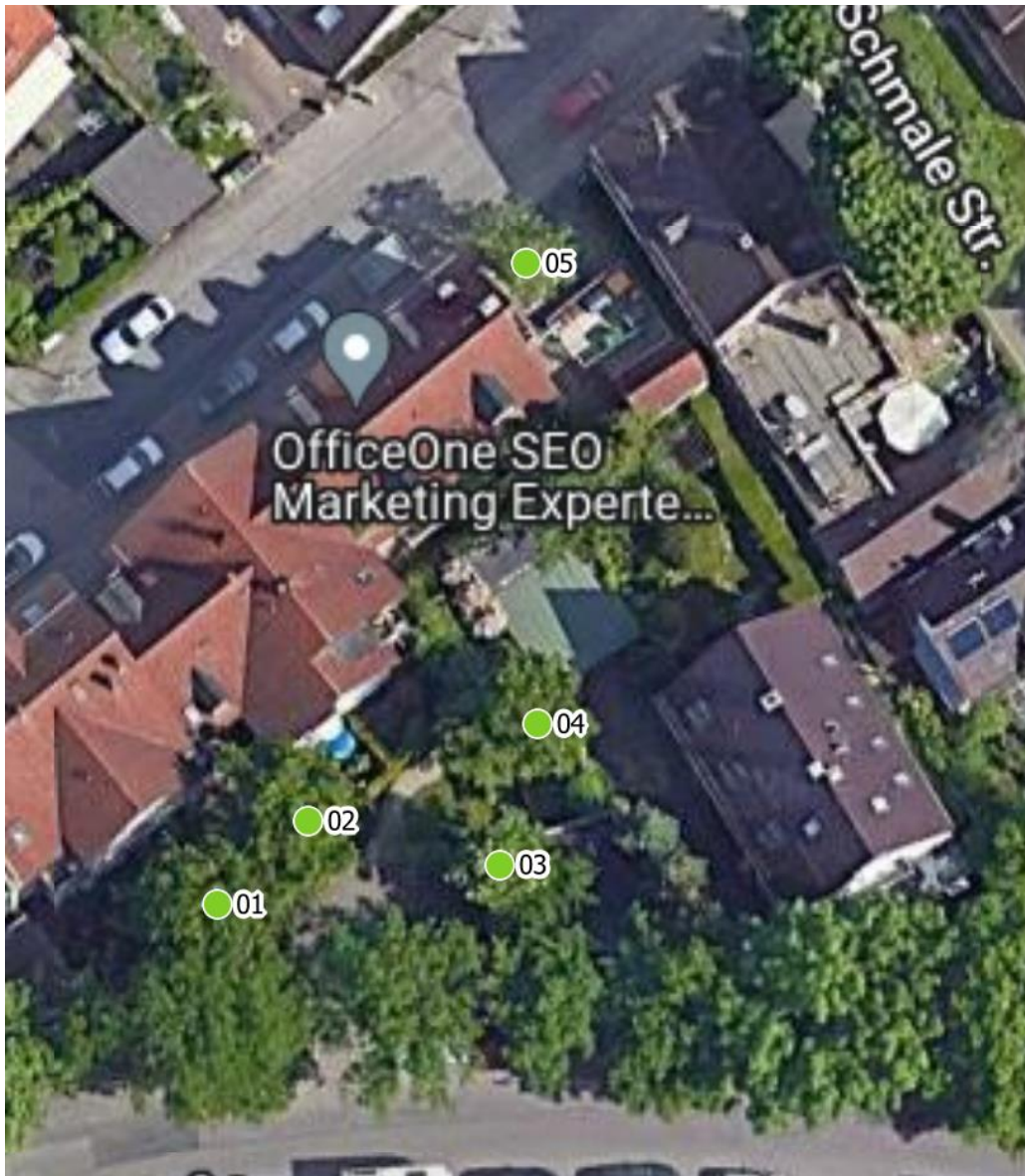
Luftbild aus dem Baumkataster