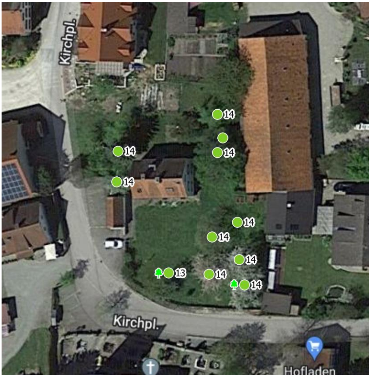
Luftbild 1: Pfarrgarten

Es sind aktuell keine Maßnahmen erforderlich.