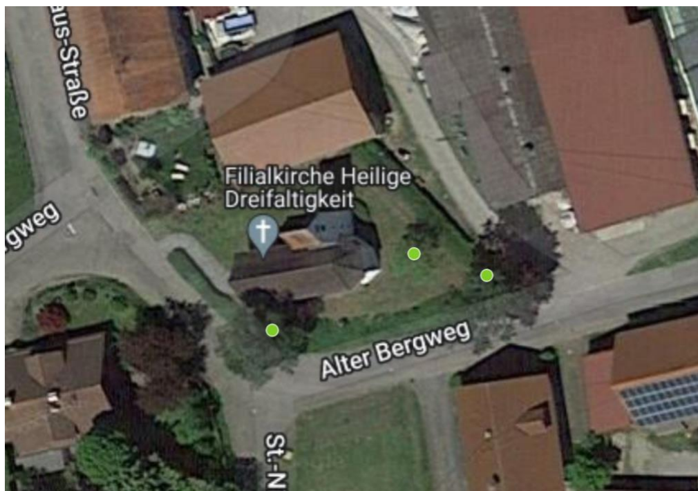
Luftbild 8: Filialkirche Hlg. Dreifaltigkeit Bergenstetten