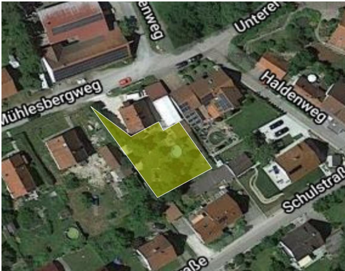
Luftbild 3: Wohnhaus Unterer Mühlesbergweg 14