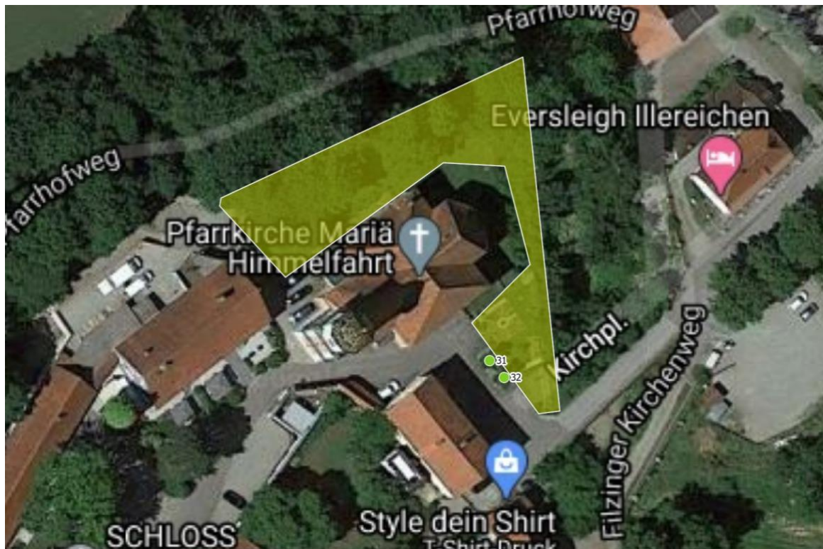
Luftbild 6: Kirche Mariä-Himmelfahrt Kirchplatz 1, 89281 Illereichen