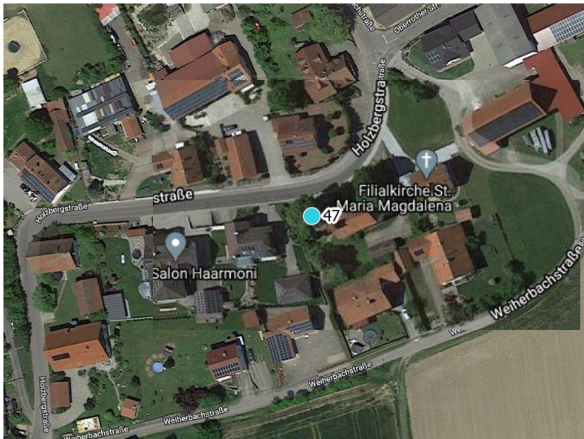
Luftbild 4: Kirche Maria Magdalena Holzbergstr. 5, 89281 Dattenhausen