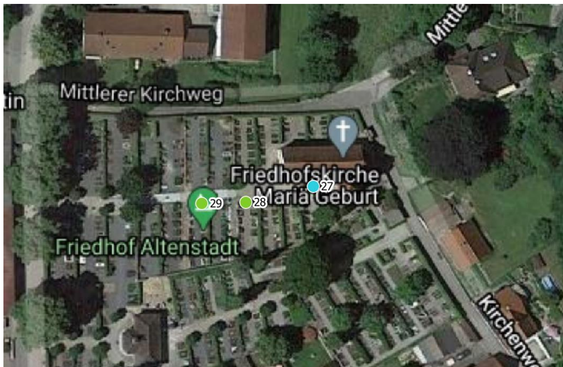
Luftbild 2: Kirche Mariä-Geburt Kirchenweg 4, 89281 Altenstadt