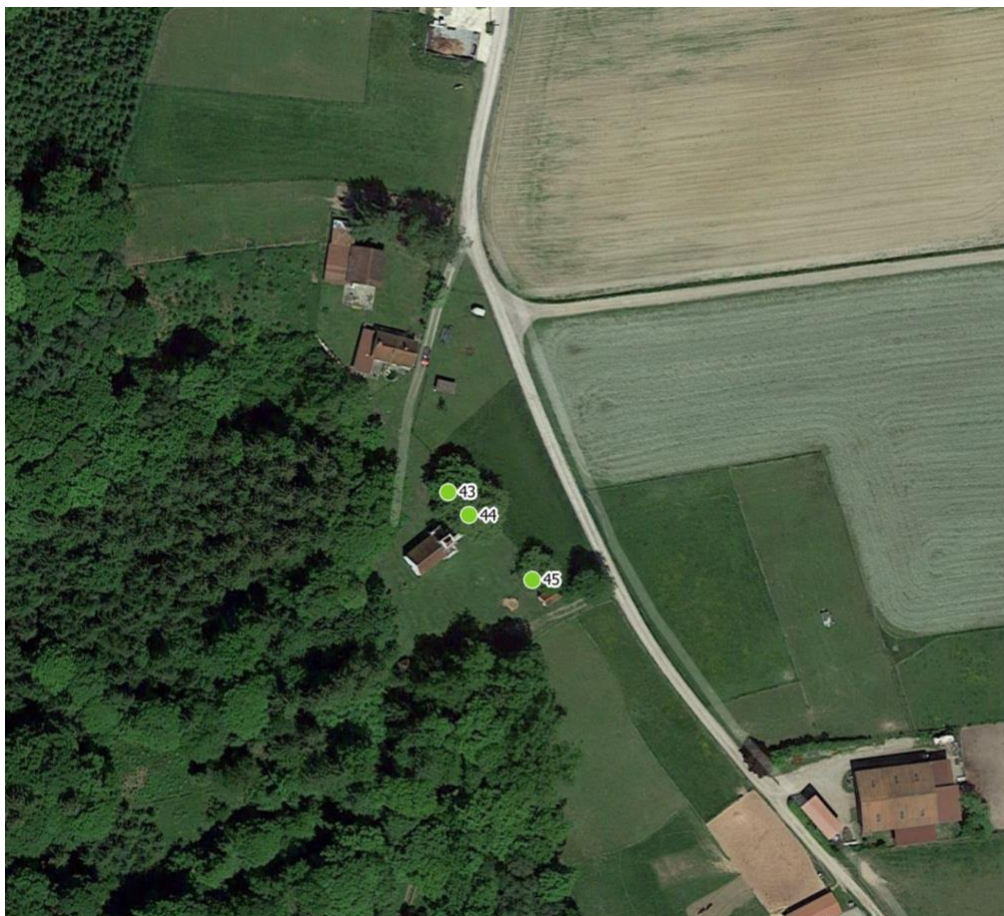
Luftbild 7: Pestkapelle Illereichen Gottesackerstr. 1, 89281 Illereichen