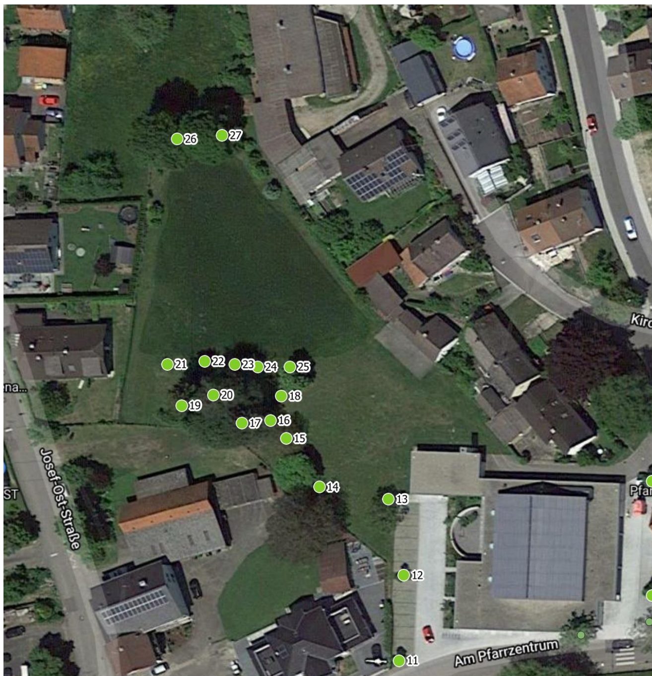
Luftbild 2: Pfarrgarten Am Pfarrzentrum 2, 89257 Illertissen