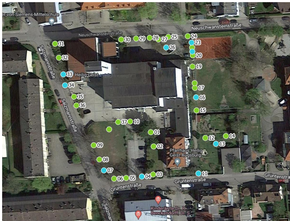
Luftbild 1: Pfarrbüro & Pfarrkirche