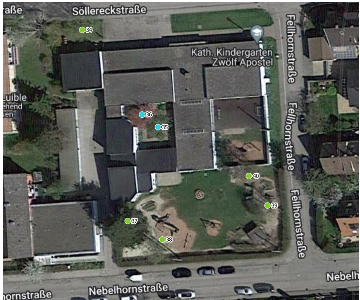
Luftbild 2: Kindergarten Söllereckstr. 10, 86153 Augsburg