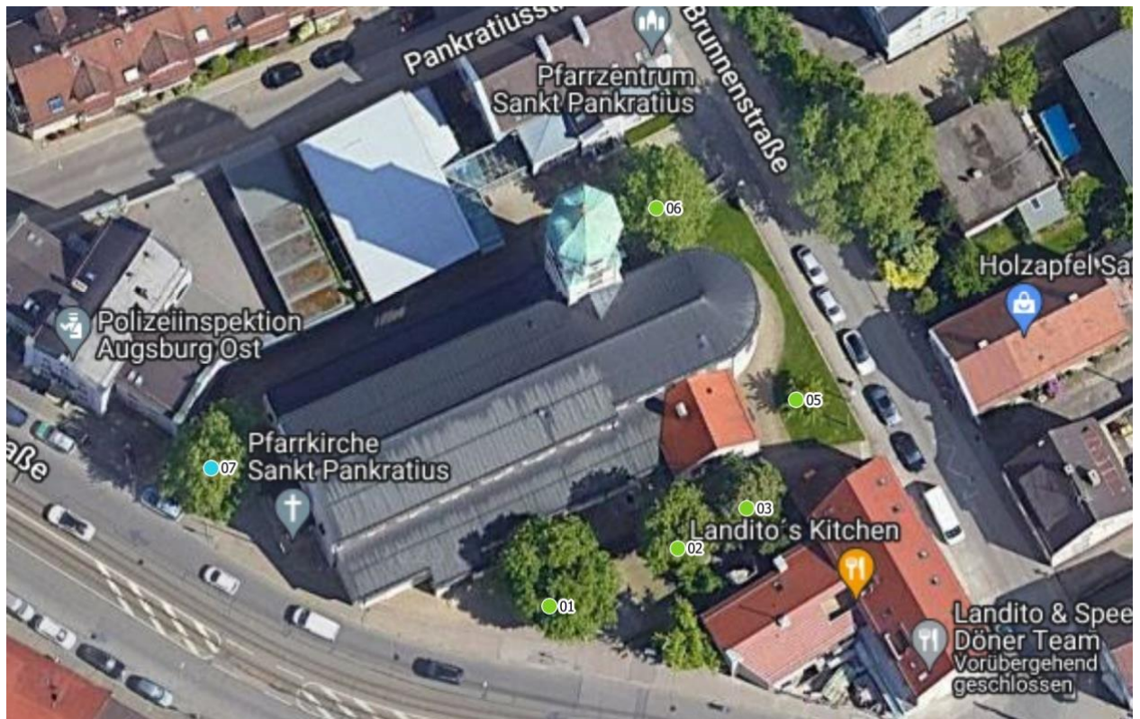
Luftbild 1: Pfarrkirche Blücherstraße 12, 86156 Augsburg