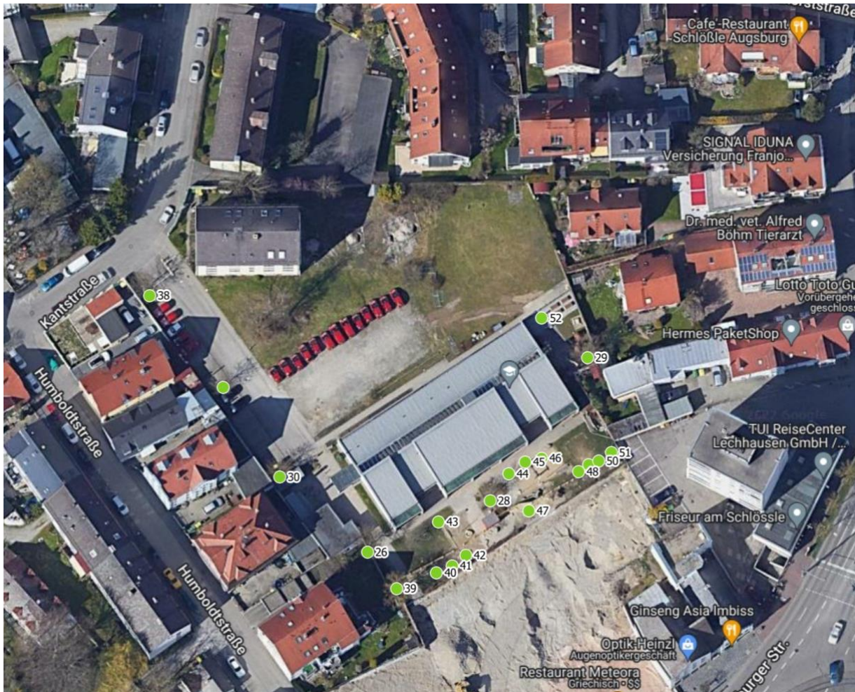
Luftbild 3: Kath. Kinderhaus St. Pankratius, Kantstr. 4a, 86156 Augsburg