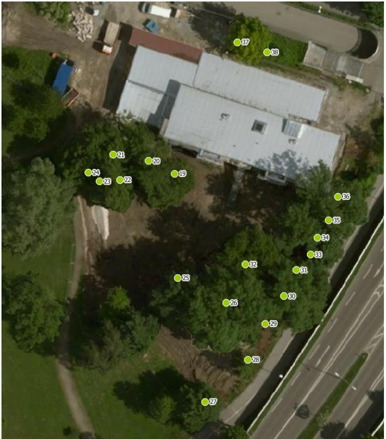
Luftbild 2: Kath. Lechpark-Kindergarten, Schackstr. 46, 86165 Augsburg,