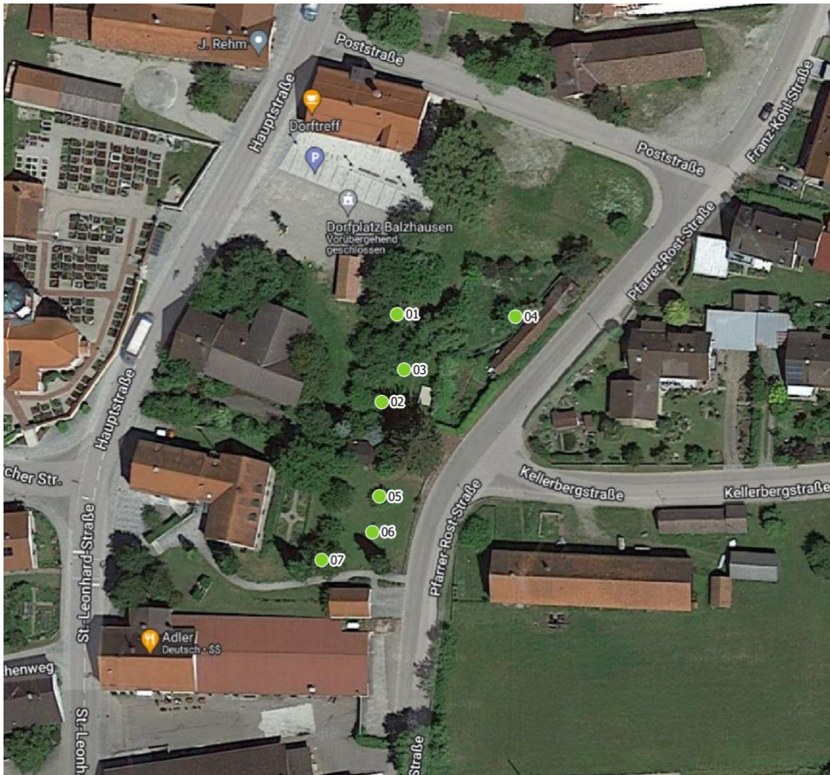
Luftbild aus dem Kataster