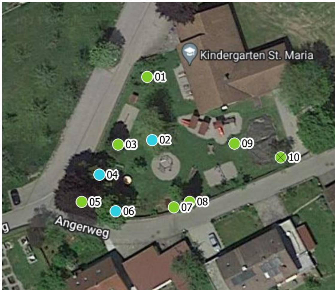
Luftbild aus dem Kataster