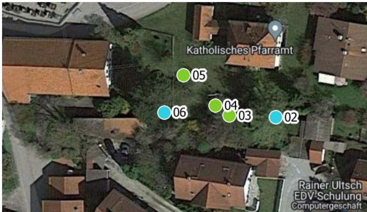
Luftbild 2: Pfarrhofgarten Schulstraße 8, 86911 Dießen Flnr. 10