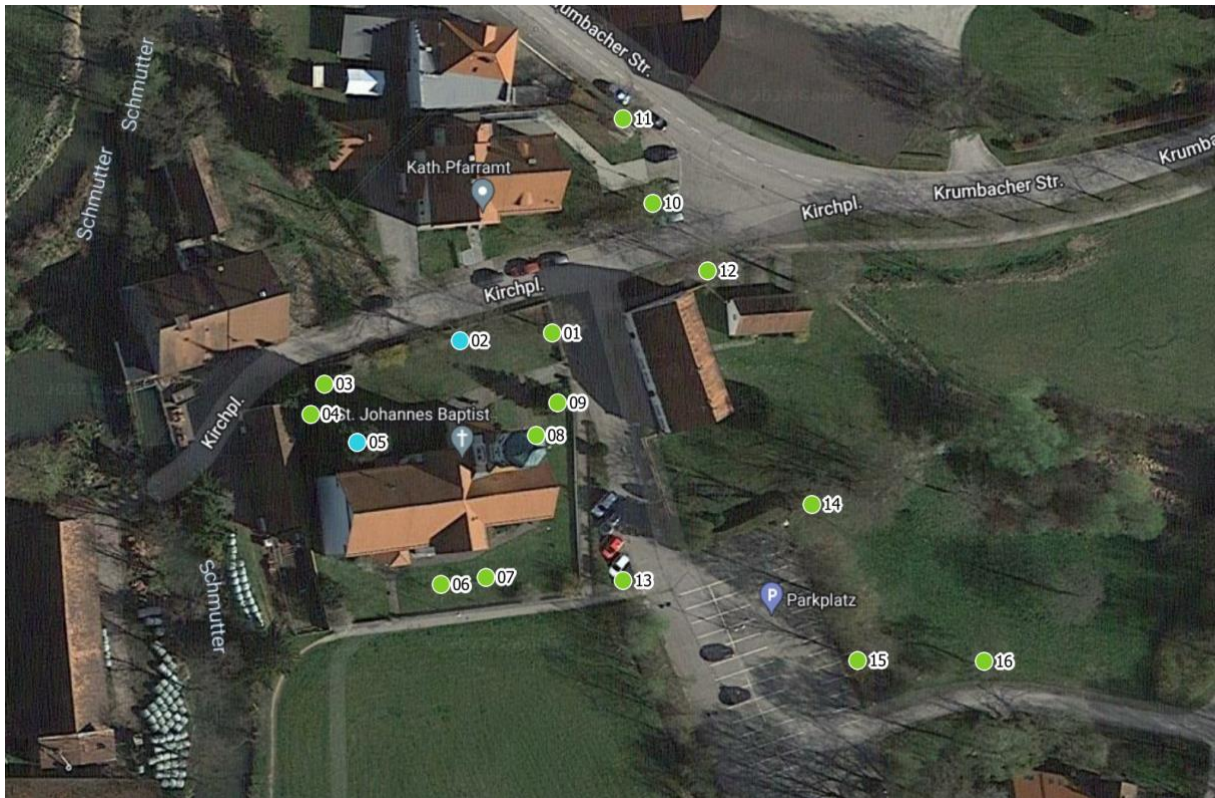
Luftbild aus dem Baumkataster

Maßnahmen, um die Verkehrssicherheit herzustellen: