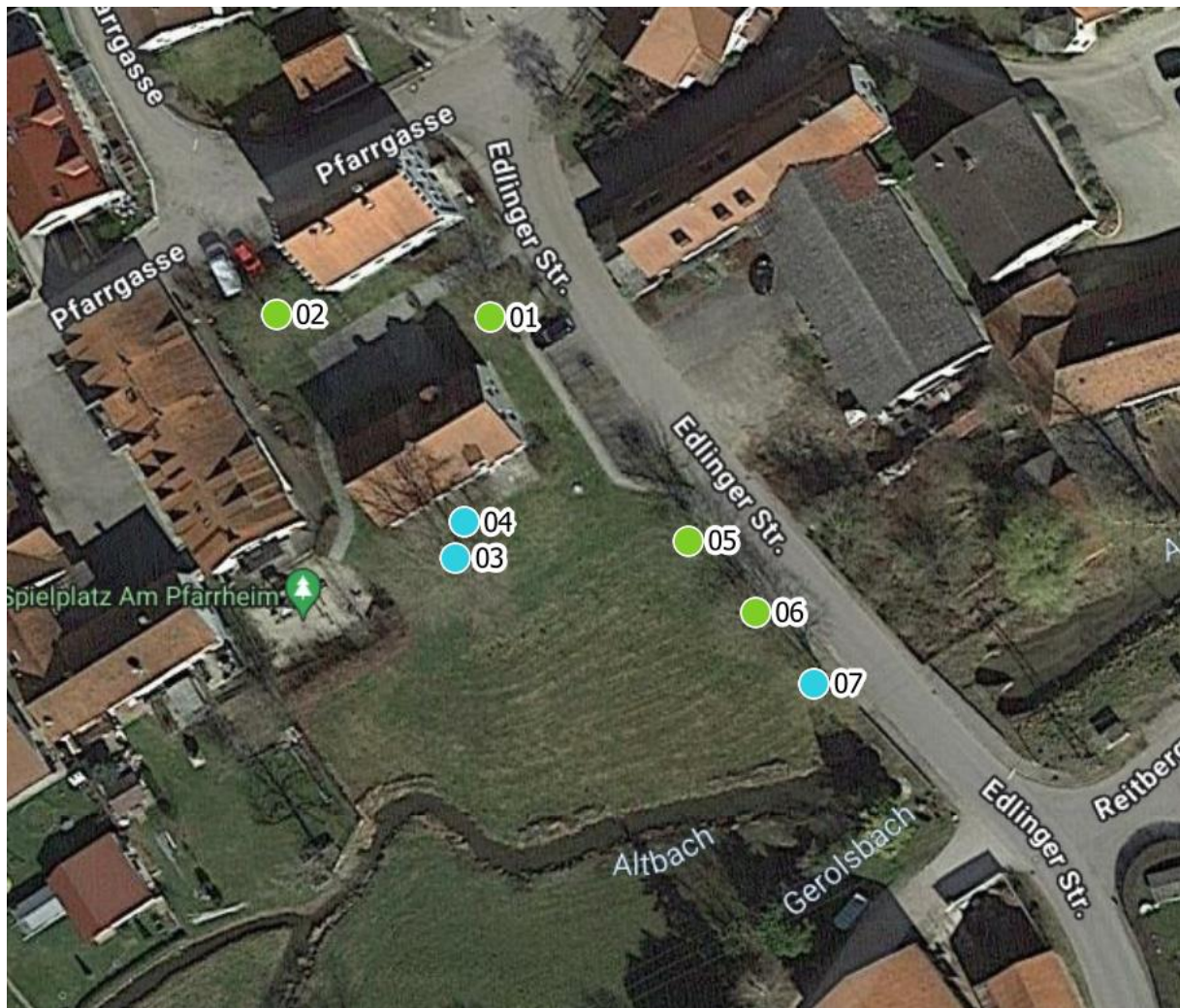
Luftbild 1: Pfarrheim Pfarrgasse 16, Euernbach