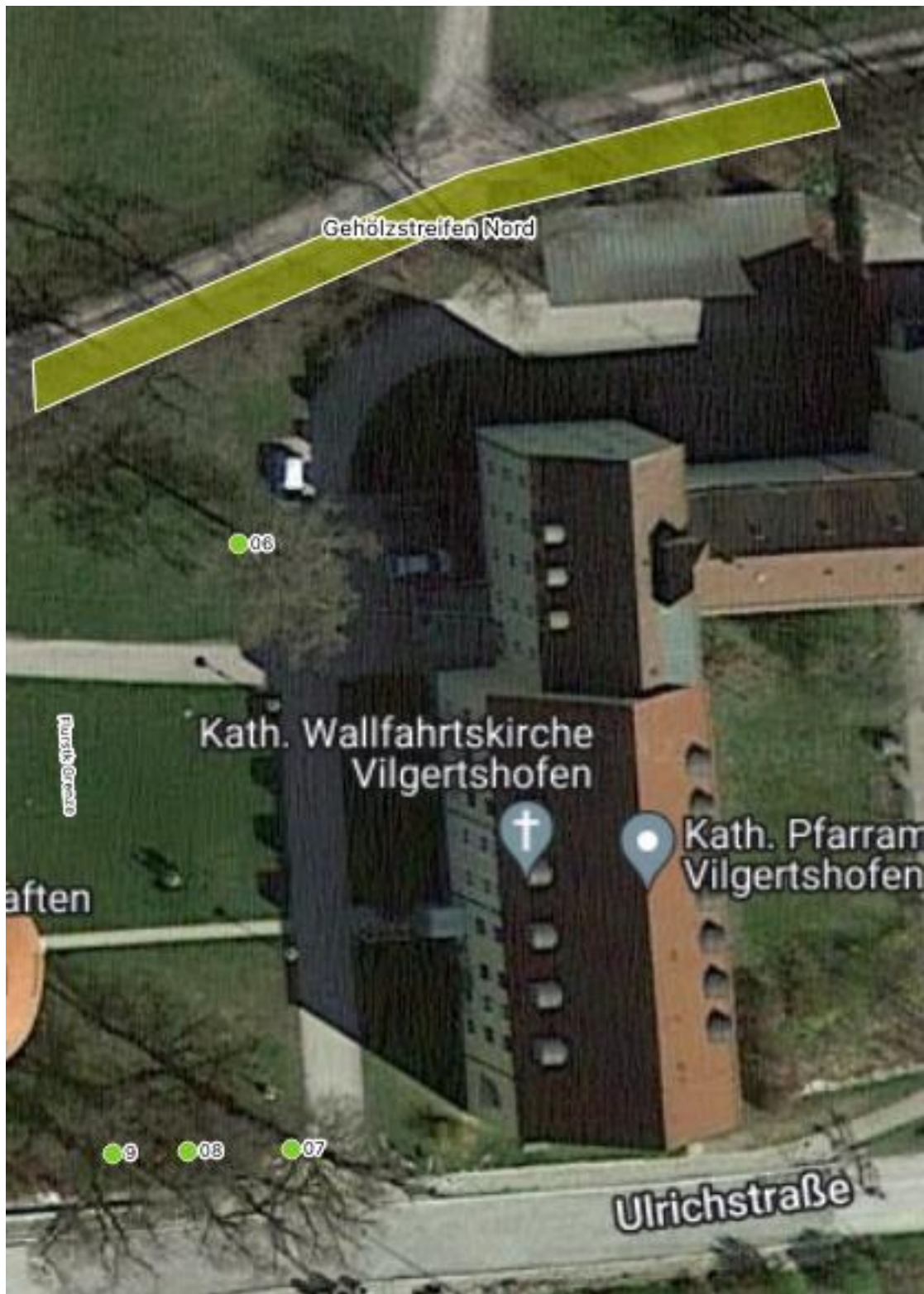
Luftbild aus dem Baumkataster