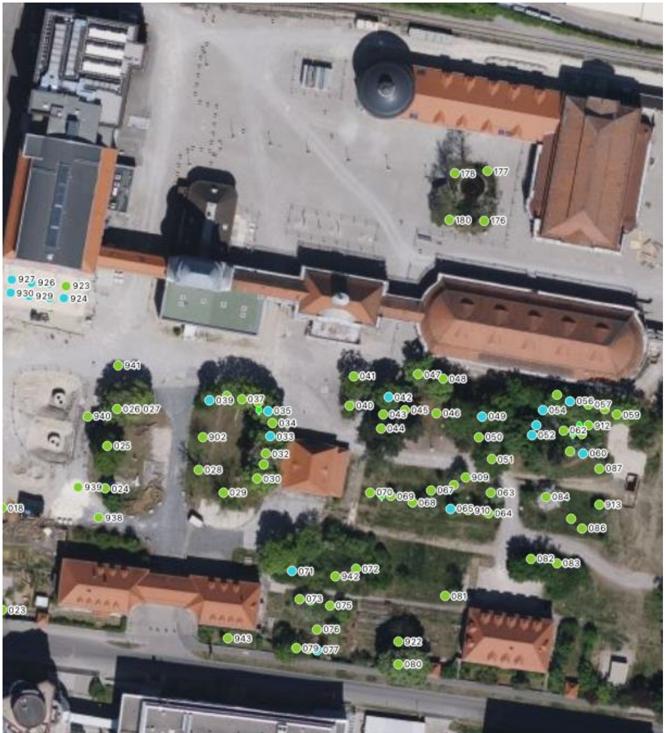
Luftbild Mitte: August-Wessels-Str. 30 Augsburg

Sachverständigenbüro: Telefon: E-Mail: Homepage: