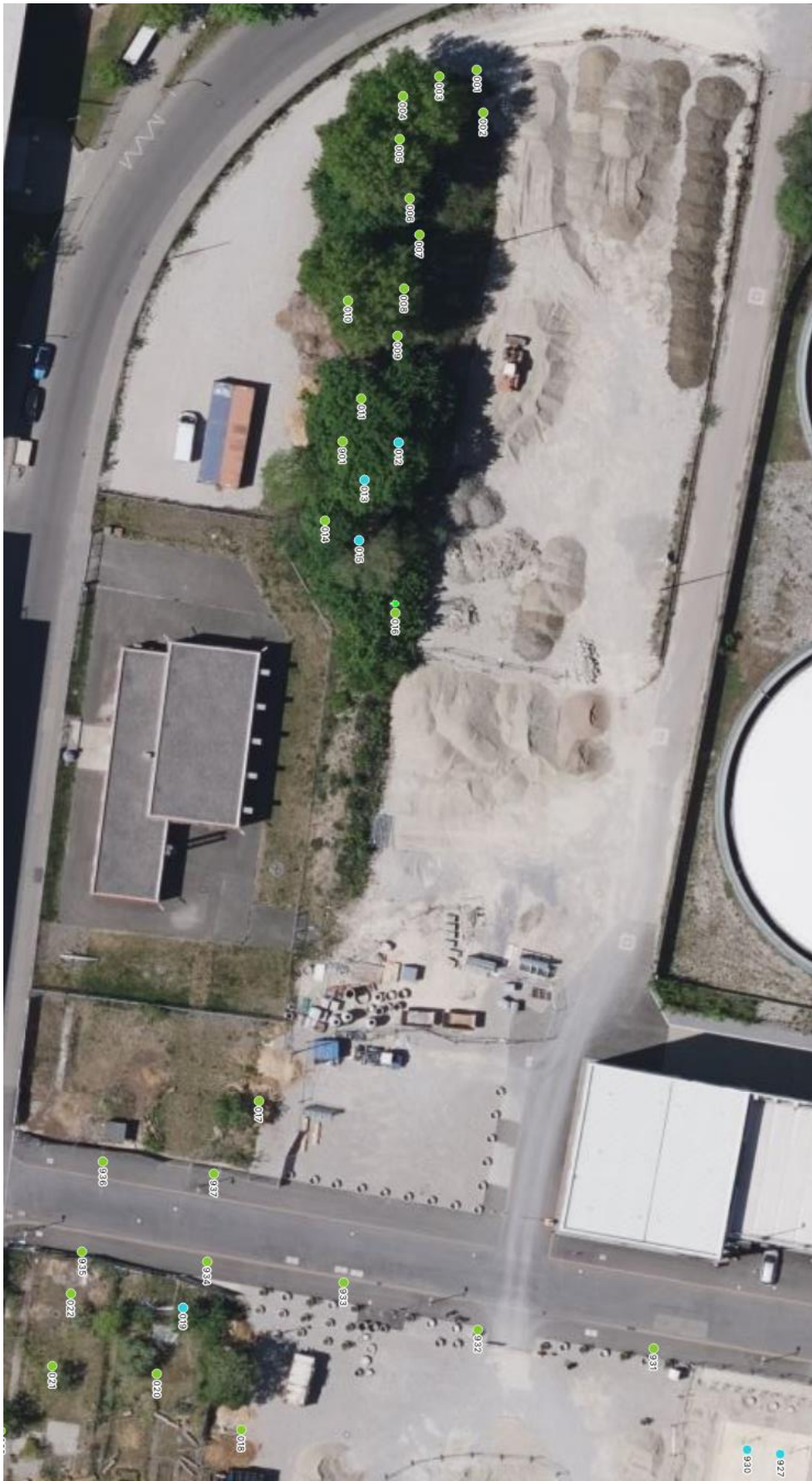
Luftbild 2 West: August-Wessels-Str. 30 Augsburg

Sachverständigenbüro: Telefon: E-Mail: Homepage: