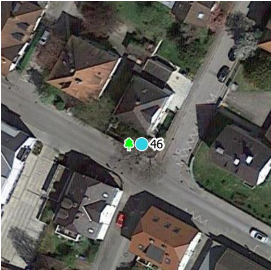
Luftbild 1: Wohnhaus Karl-Böhaimb Str. 1, 82362 Weilheim