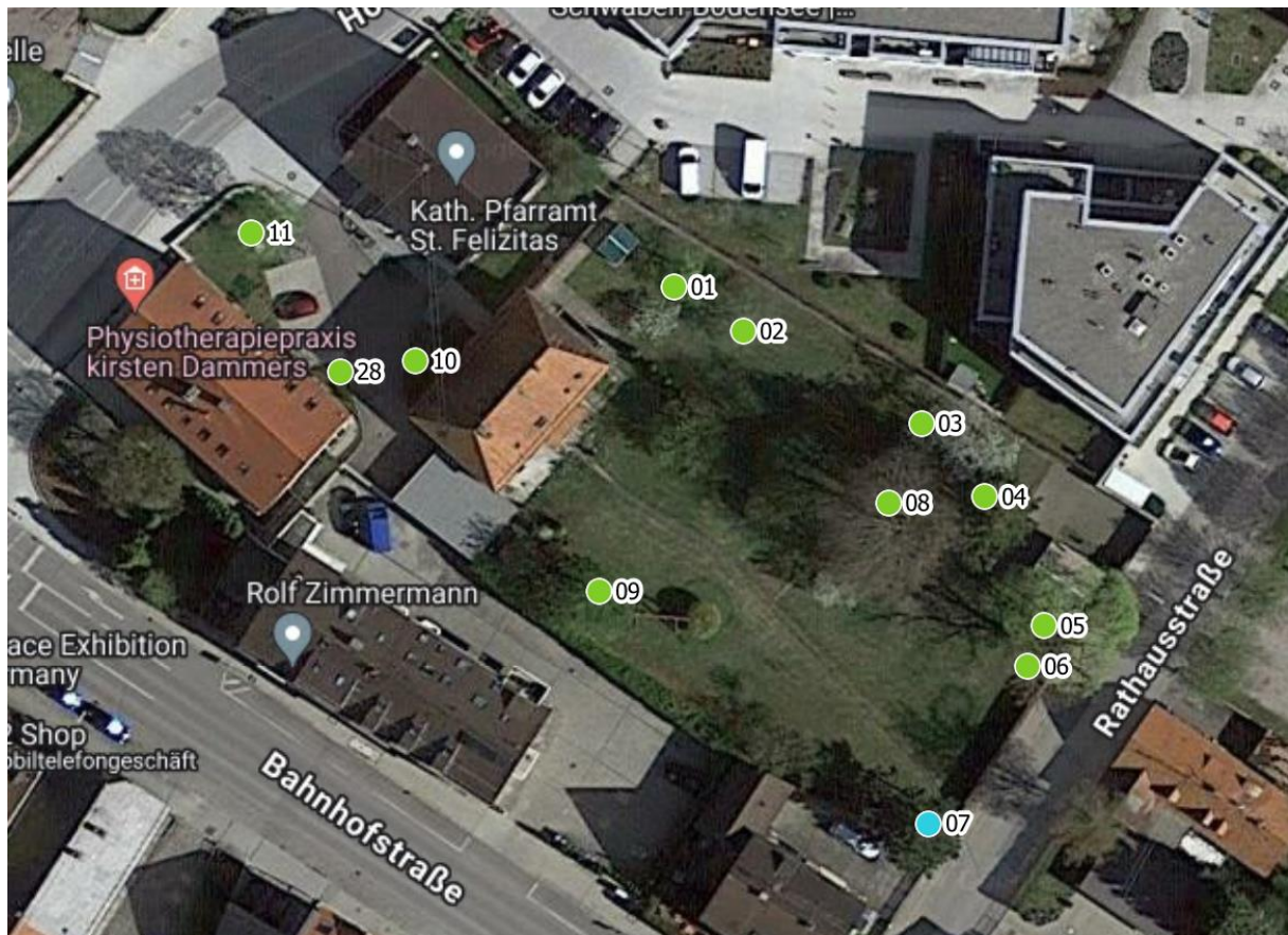
Luftbild 1: Pfarrheim & Pfarrgarten Hochstr. 2a +2b, 86399 Bobingen FlNr. 290,