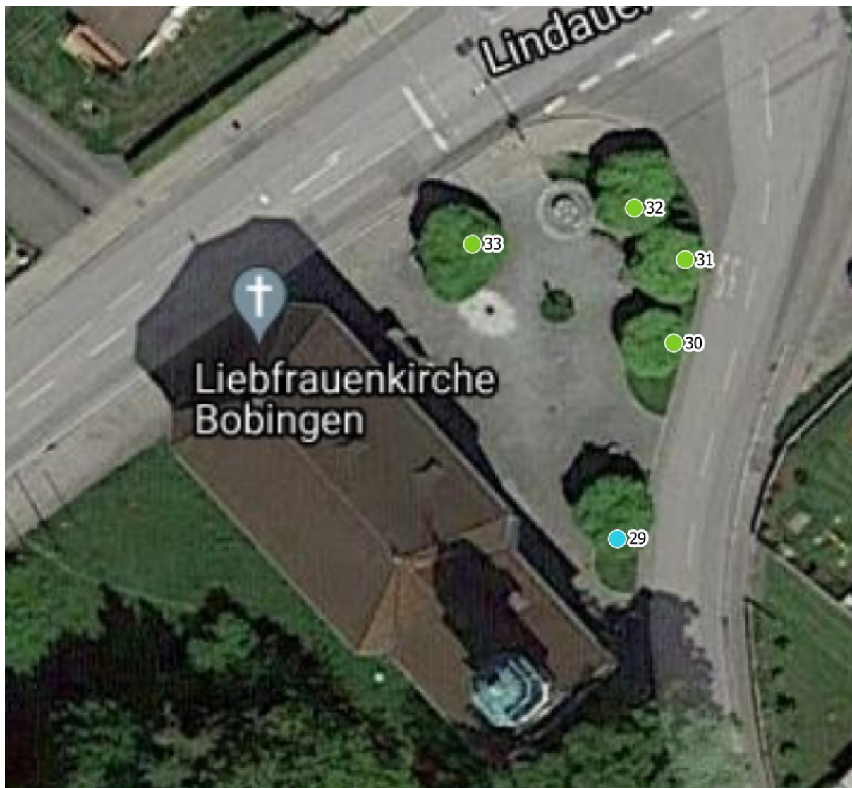
Luftbild 3: Liebfrauenkirche Bobingen Lindauer Str. 39, 86399 Bobingen