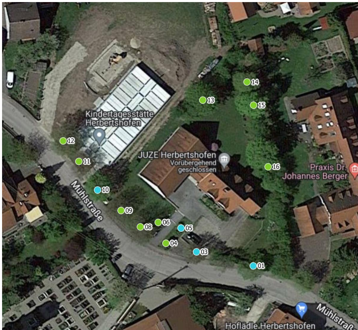
Luftbild 1: Pfarrheim Mühlstraße 9, 86405 Herbertshofen