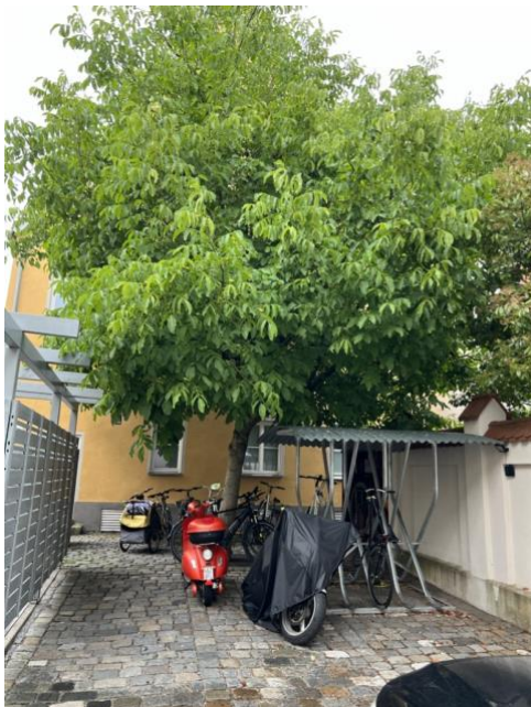
Bild: Ansicht der Walnuss

Es handelt sich um eine junge Walnuss, die durch die Baumschutzverordnung der Stadt Augsburg geschützt ist.