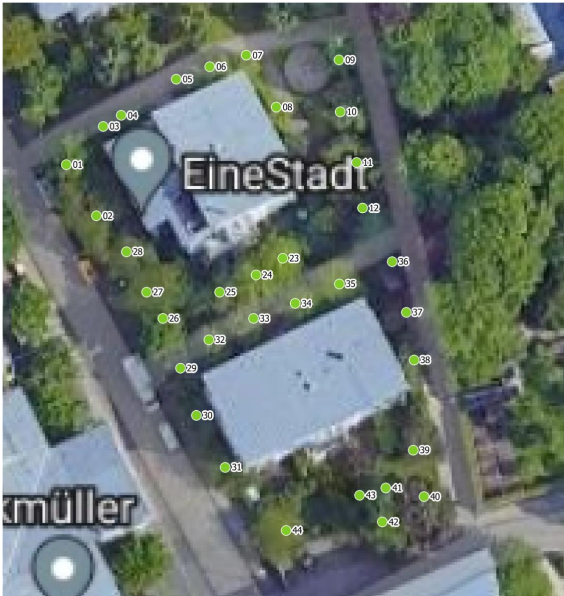
Luftbild aus dem Baumkataster