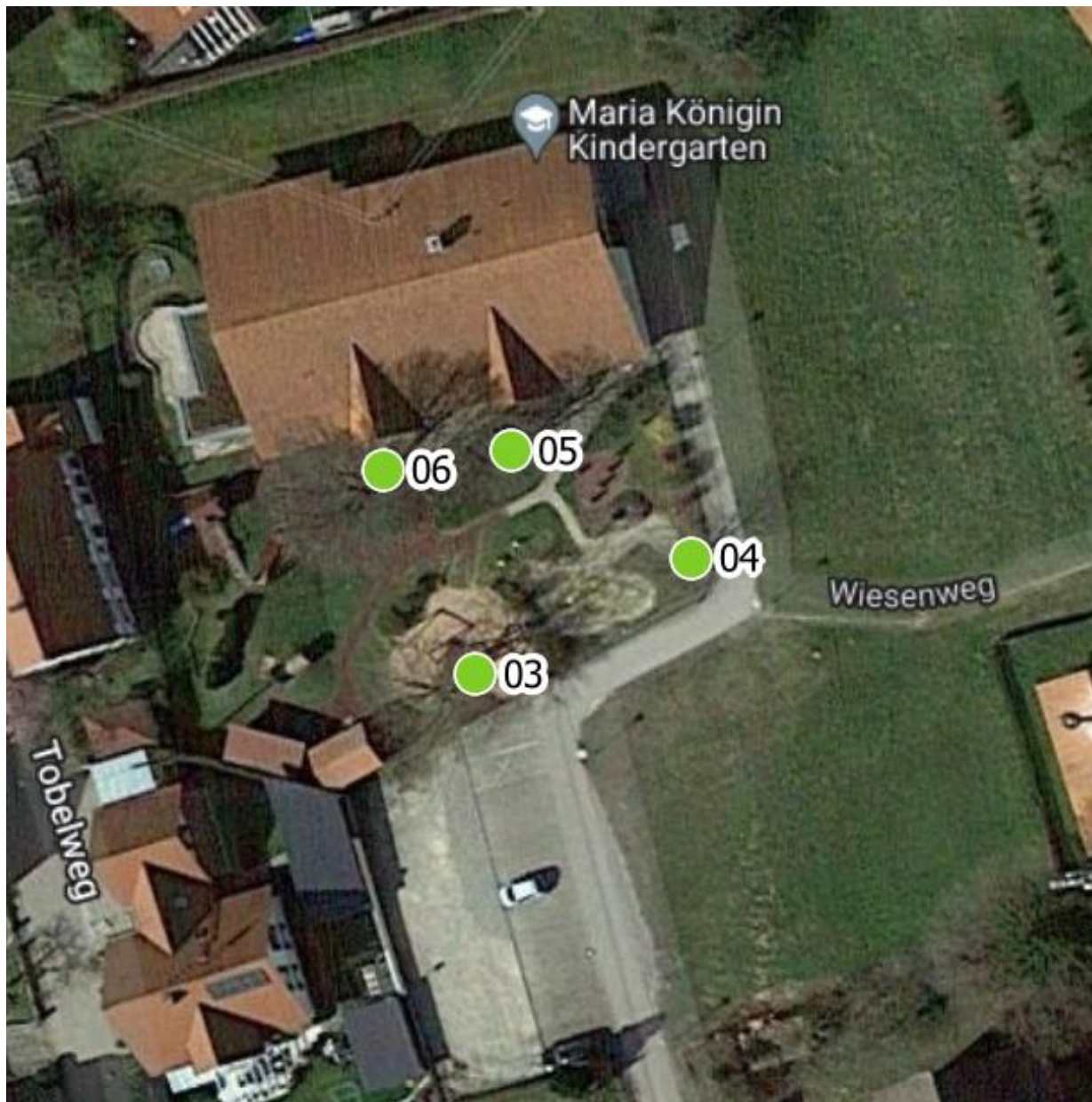
Luftbild 2: Kindertagesstätte Maria Königin Haselbader Straße 31, 87757 Kirchheim