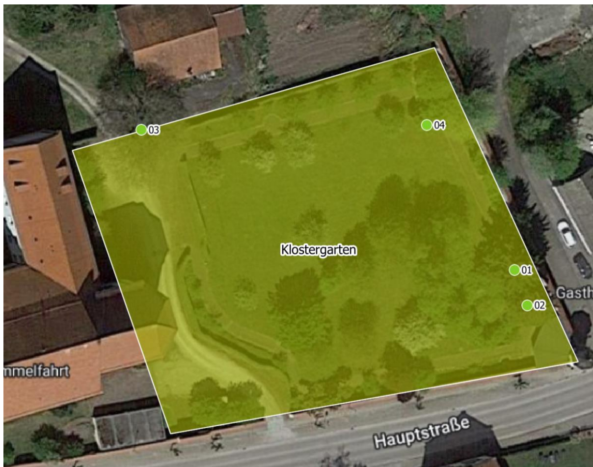
Luftbild aus dem Baumkataster

Die visuelle Regelbaumkontrolle hat Folgendes ergeben: