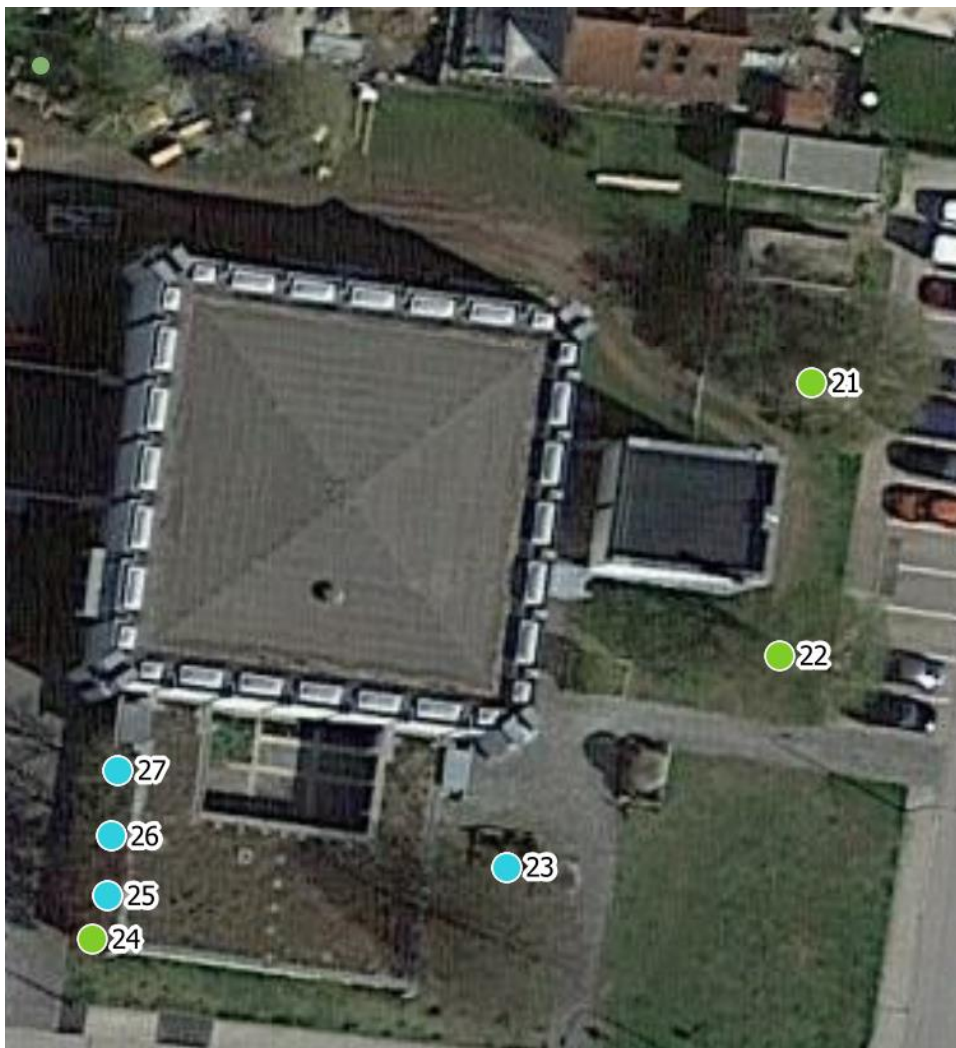
Luftbild 1: Pfarrgelände Riedstr., 86391 Stadtbergen