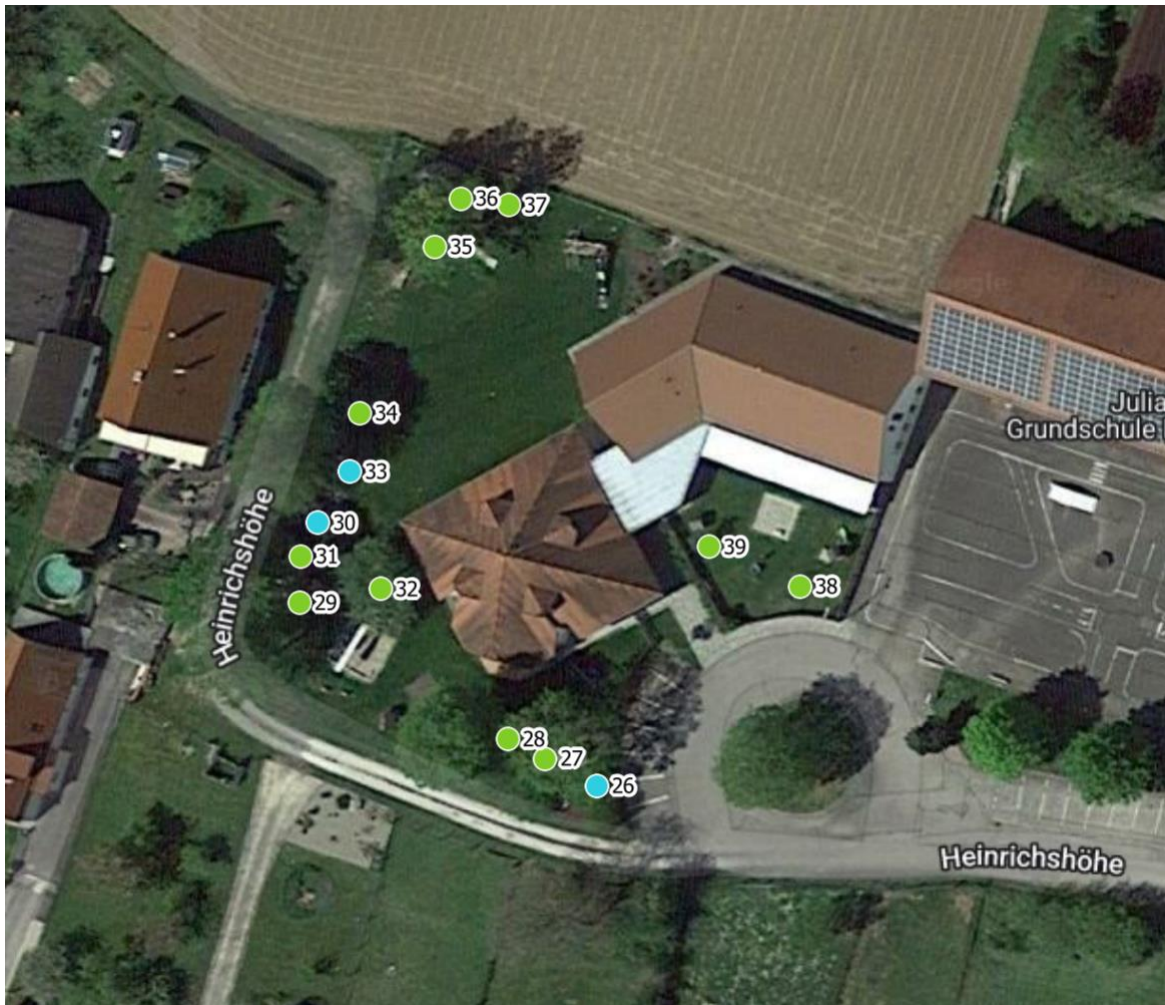
Luftbild 2: Kindergarten Heinrichshöhe 7, 86688 Marxheim Flnr. 487/1