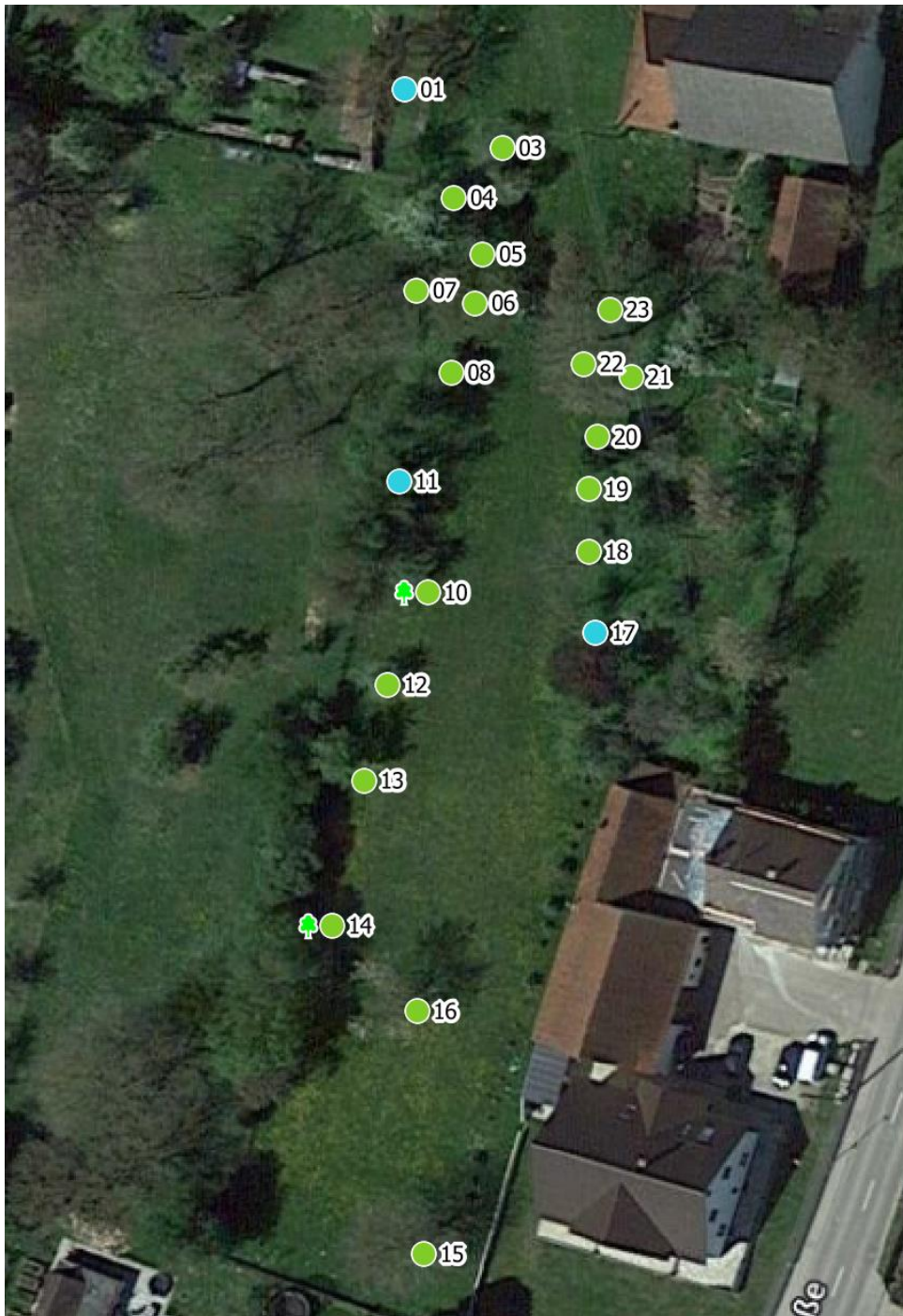
Luftbild 1: Pfarrgarten Bayernstr. 10, 86688 Marxheim Flnr.115,