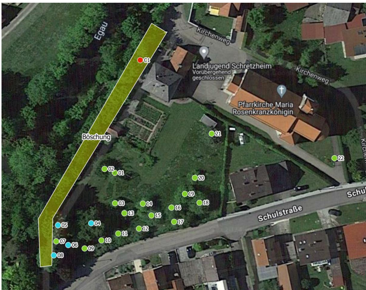
Luftbild 1: Pfarrkirche und Pfarrgarten Kirchenweg Dillingen

Sachverständigenbüro: Telefon: E-Mail: Homepage: