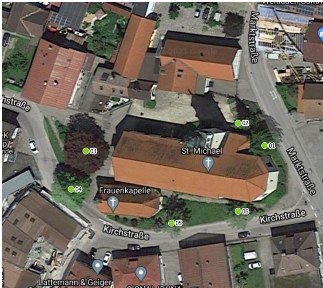
Luftbild 1: Pfarrkirche Kirchstraße 11, 87527 Sonthofen