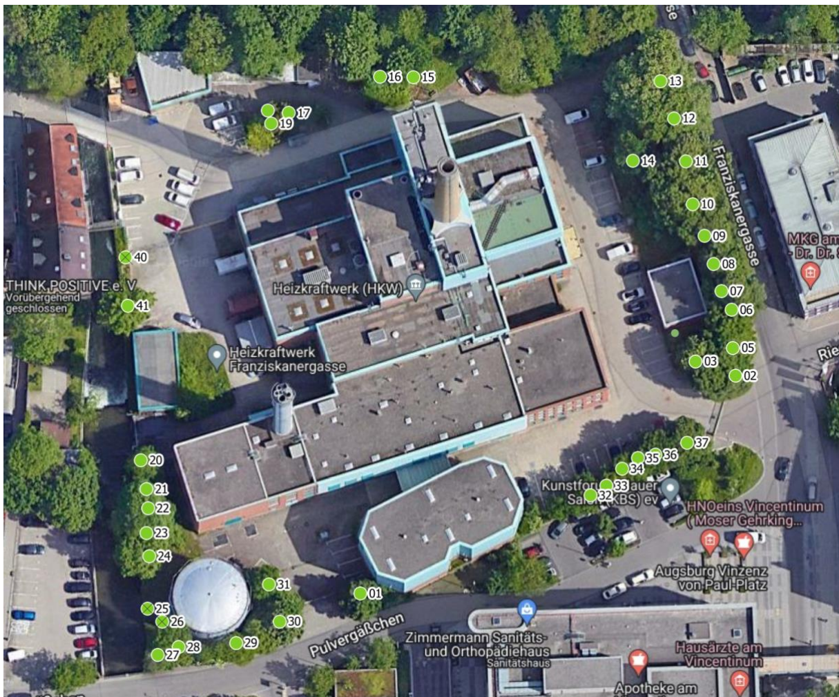
Luftbild 1: Heizkraftwerk Franziskanergasse