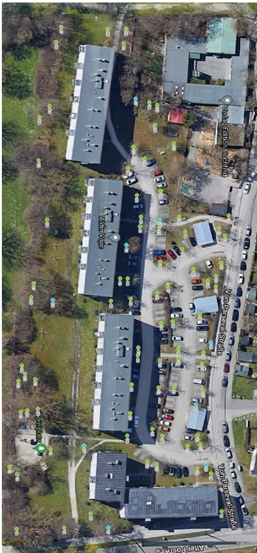
Luftbild aus dem Kataster um 90° nach Osten gedreht

Sachverständigenbüro: Telefon: E-Mail: Homepage: