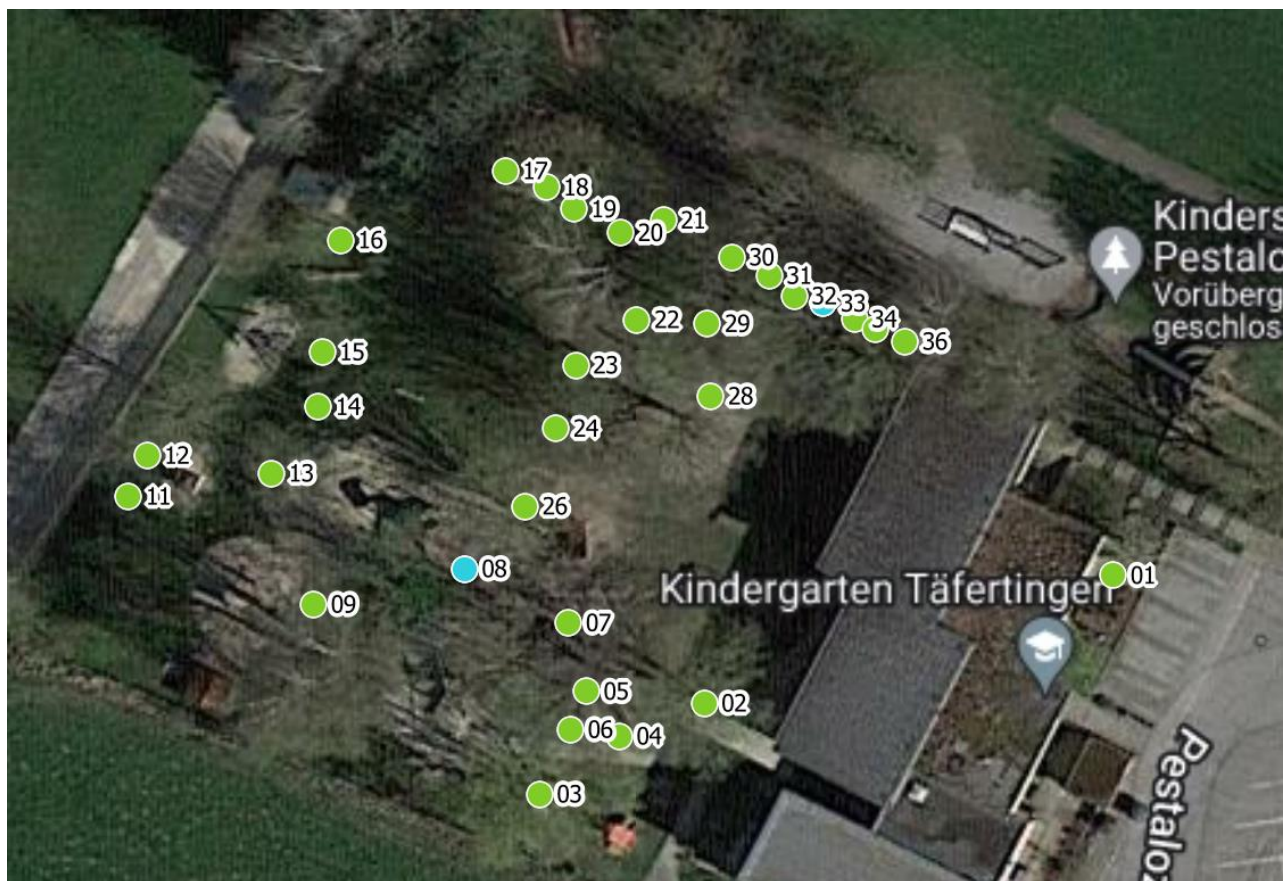
Luftbild 1: Kinderhaus und Gemeindehaus