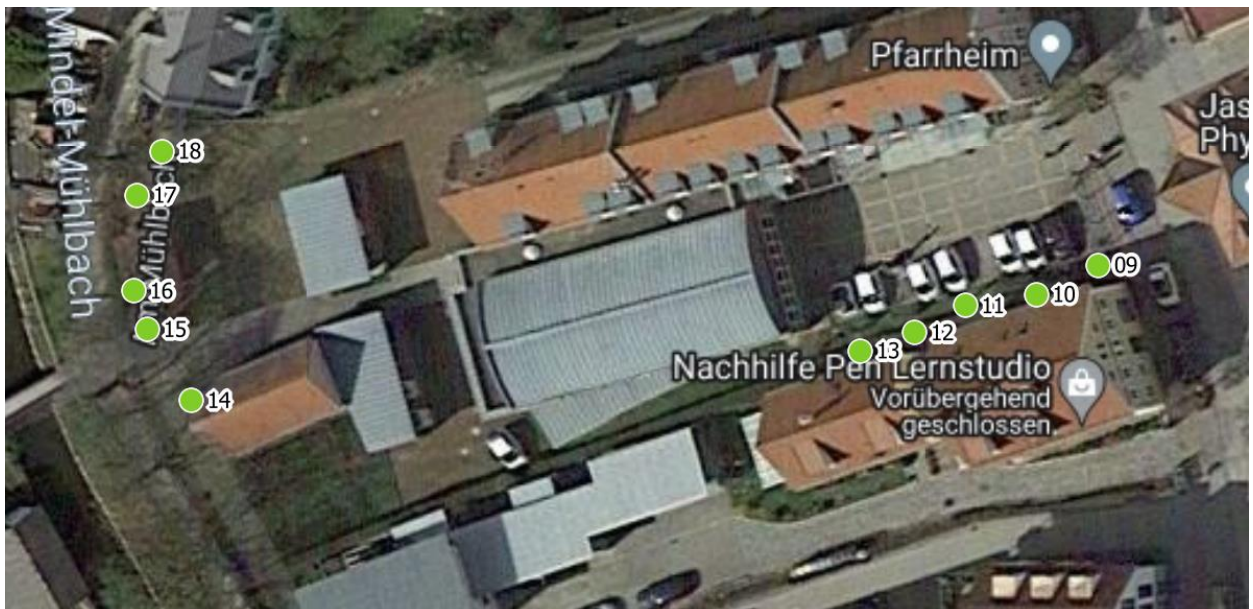
Luftbild 2: Pfarrheim Frühmess-Str. 9, 86470 Thannhausen