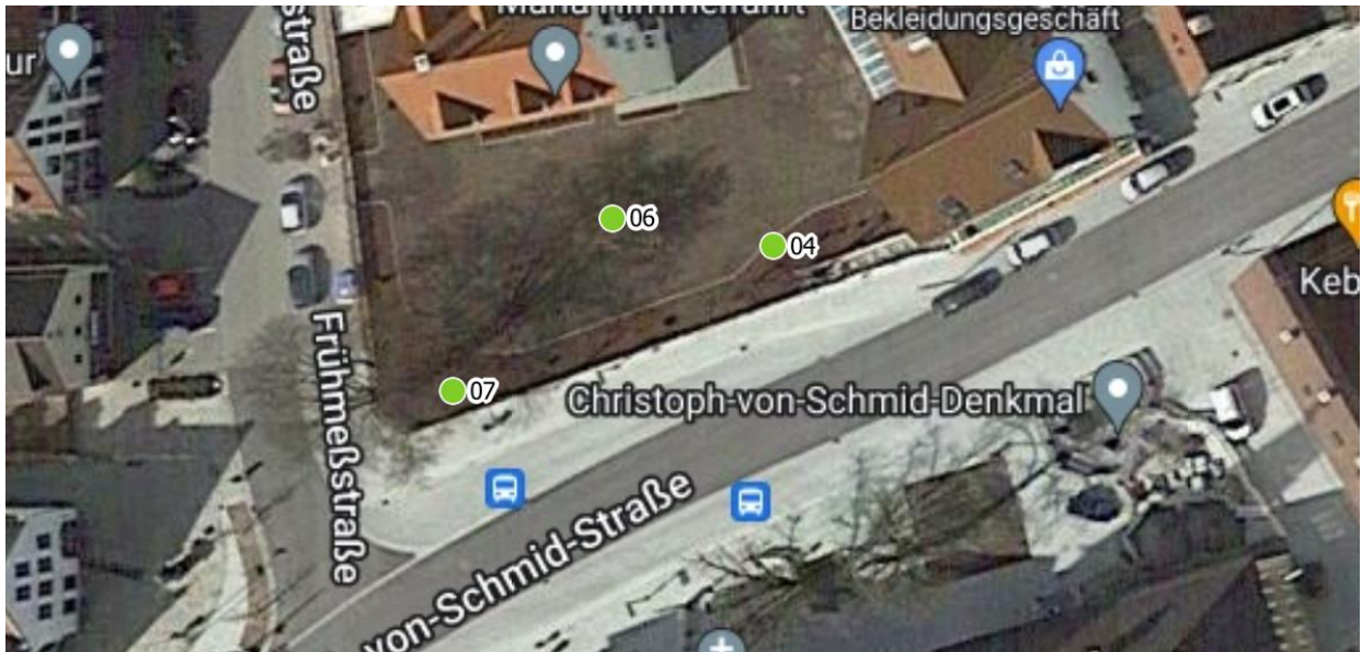
Luftbild 1: Pfarrgarten Christoph-von-Schmid-Str. 10, 86470 Thannhausen