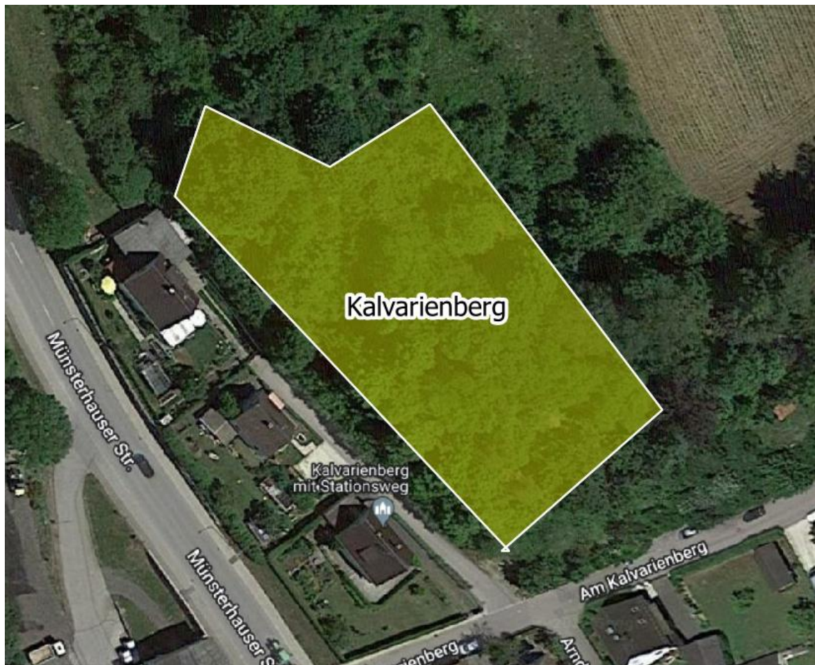
Luftbild 3: Kalvarienberg Herrgottsberg, 86470 Thannhausen

Der Bestand des Kalvarienbergs wurde als flächiger Bestand erfasst.