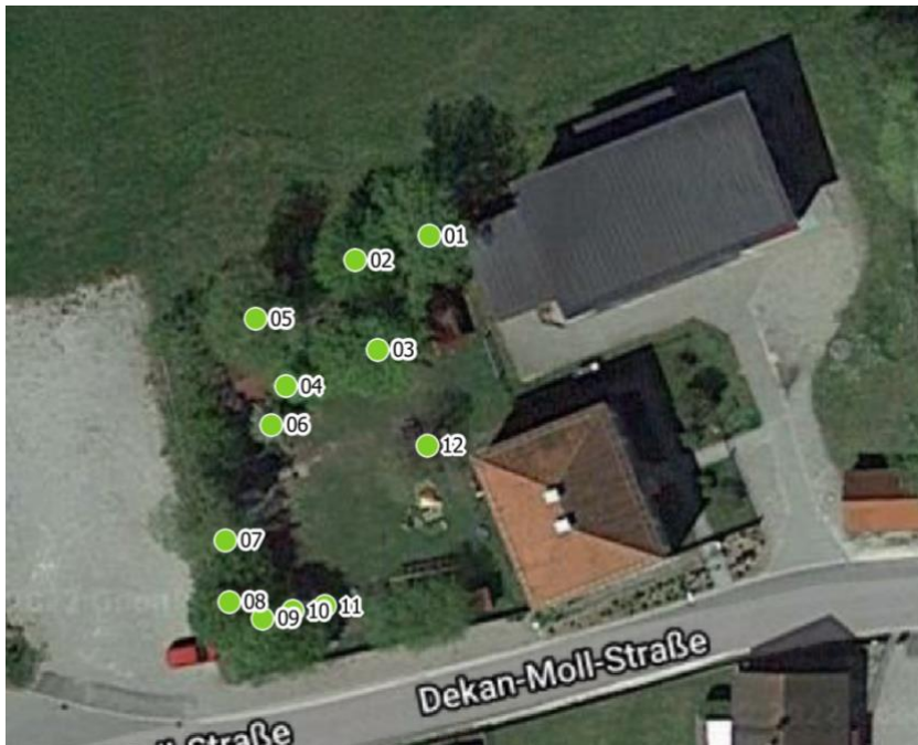
Luftbild aus dem Baumkataster

Die visuelle Baumkontrolle hat ergeben, dass die Verkehrssicherheit gewährleistet ist.