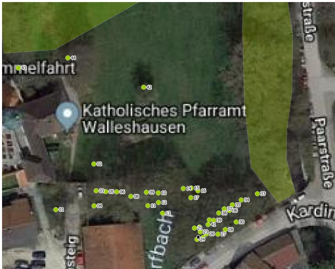
Luftbild 1: Pfarrgarten Kardinal-Brandmüller-Platz 1, 82269 Geltendorf Flnr. 35/0